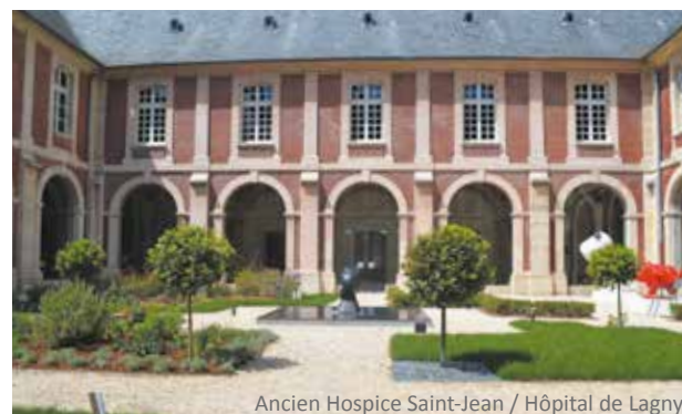
Ancien Hospice Saint-Jean / Hôpital de Lagny