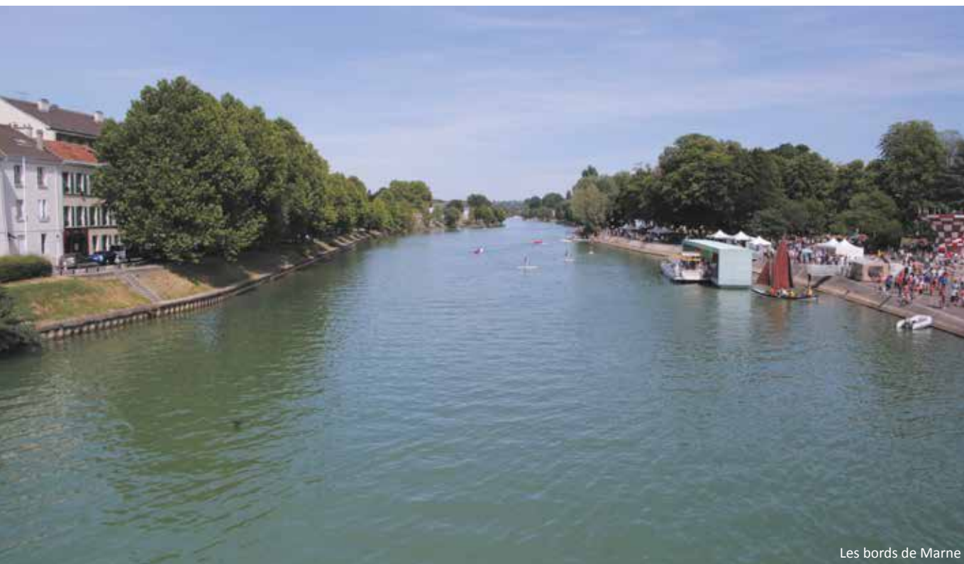
Les bords de Marne

Lagny-sur-Marne offre un cadre agréable et en plein renouveau, à l'image du site Saint-Jean où prend place "Altana". Ce vaste terrain de 10 hectares accueillant l'ancien hôpital de Lagny devient un lieu de vie recherché proche du centre-ville et de la gare SNCF. Autour des beaux bâtiments du XIX e siècle conservés, des réalisations contemporaines s'élèvent. Des bosquets d'arbres remarquables et des espaces verts réaménagés forment un parc public privilégié où les résidents aiment flâner. Ils profitent ainsi pleinement de cet écrin de bien-être et des vues sur les coteaux de la Marne.