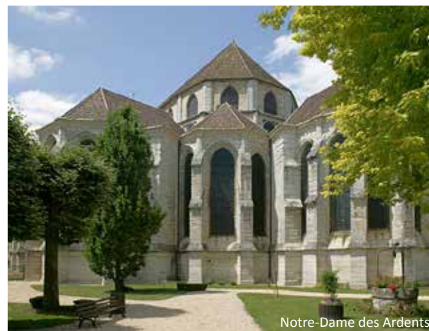
Notre-Dame des Ardents

Ces atouts lui assurent donc une dynamique constante !