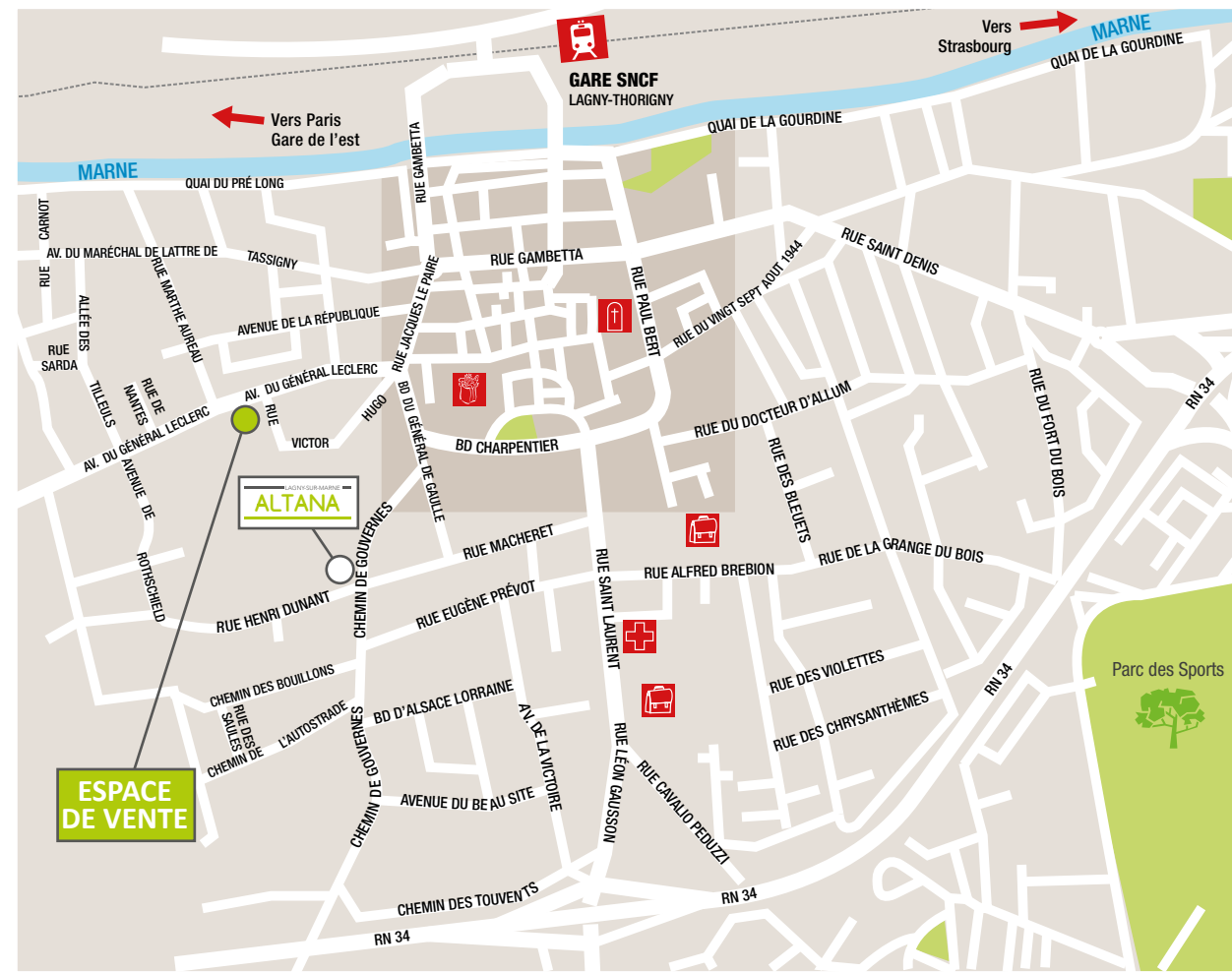
Programme réalisé par Novastrada : RCS 528 145 014 - Siège social : 36 rue de l'Arcade 75008 Paris - Illustrations, plans et photos non contractuels à caractère d'ambiance - Document non contractuel - - - Réalisation : IBIZA - Juillet 2016.